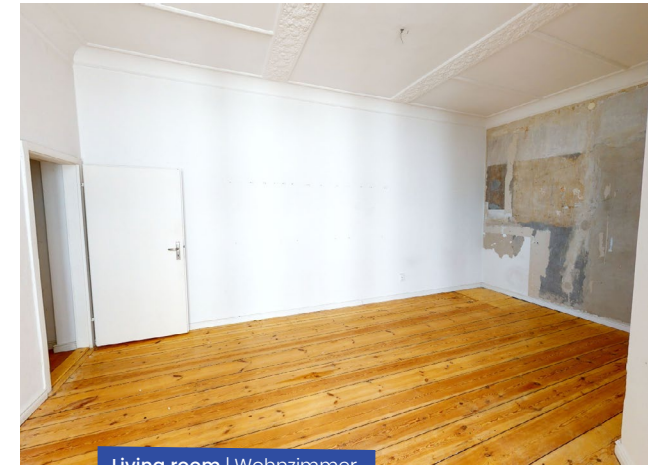
Living room | Wohnzimmer