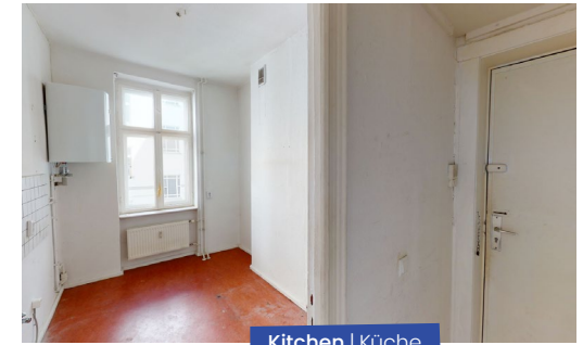
Kitchen | Küche