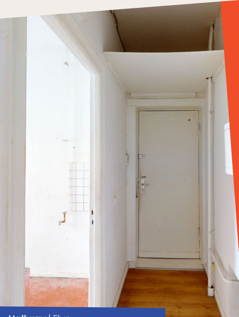
Hallway | Flur