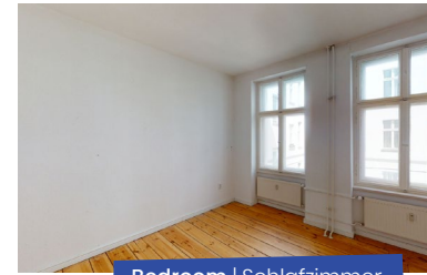
Bedroom | Schlafzimmer