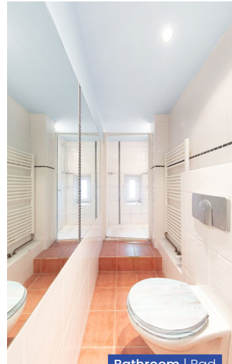
Bathroom | Bad