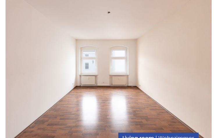
Living room | Wohnzimmer