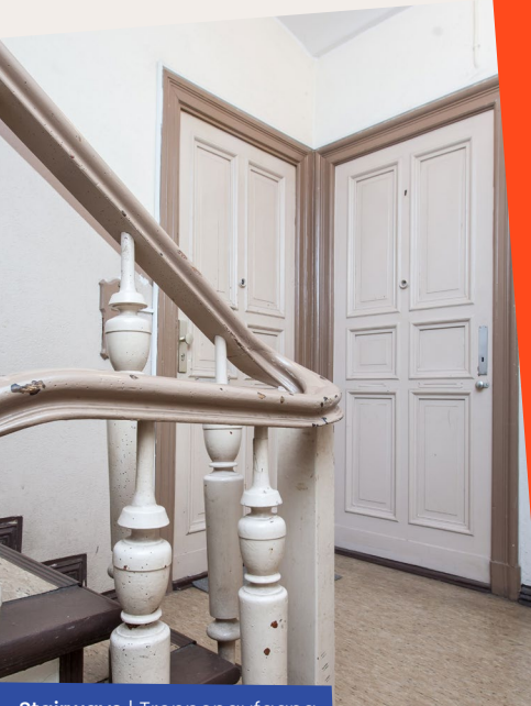
Stairways | Treppenaufgang